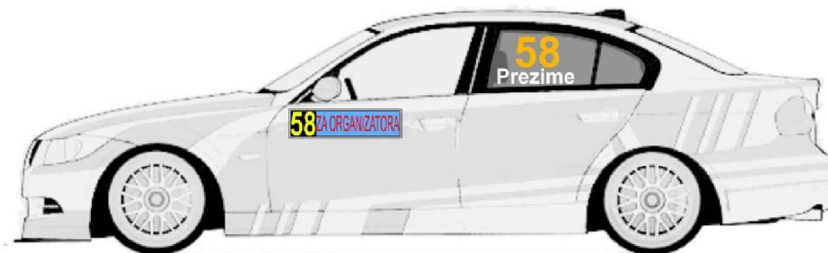
Zadnjim levim i desnim bočnim staklima, broj je visine 20cm sa debljinom linije od 2.5cm, font je Arial BOLD

Boja ovih brojeva je florescentno narandžasta i to PMS 804