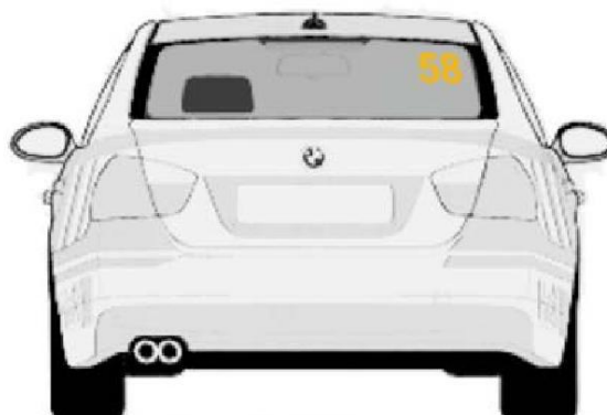
Zadnjem vetrobranskom staklu. broj je visine 14cm sa debljinom linije od 2cm, font je Arial BOLD