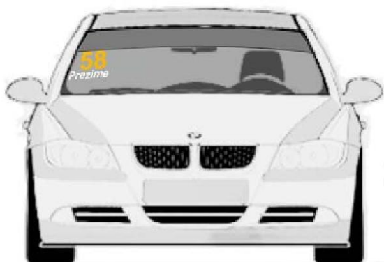
Prednjem vetrobranskom staklu. broj je visine 14cm sa debljinom linije od 2cm, font je Arial BOLD