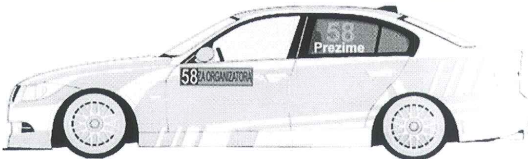
Задњим левим и десним бочним стаклима, број је висине 20cm са дебелином линије од 2.5cm, font је Anal BOLD

Боја ових бројева је флуоресцентно наранџаста и то PMS 804