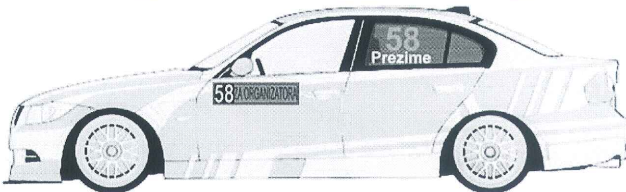
Zadnjim levim i desnim bočnim staklima, broj je visine 20cm sa debljinom linije od 2.5cm, font je Arial BOLD

Boja ovih brojeva je florescentno narandžasta i to PMS 804