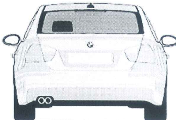
Zadnjem vetrobranskom staklu. broj je visine 14cm sa debljinom linije od 2cm, font je Arial BOLD