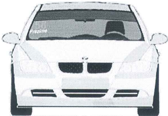
Prednjem vetrobranskom staklu. broj je visine 14cm sa debljinom linije od 2cm, font je Arial BOLD