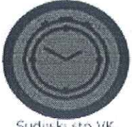
Sudijski sto VK Crvena