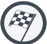
Početak zone Žuta