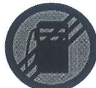
Kraj zone Plava