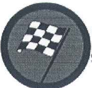
Cilj (bez zaustavljanja) Crvena