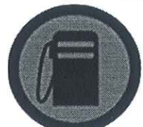
Početak zone Plava