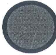
Start SI Crvena