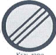
Kraj zone Oranž