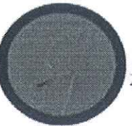
Start SI Crvena