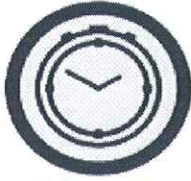
Početak zone Žuta