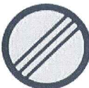
Kraj zone Oranž