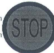
STOP (upis vremena) Crvena