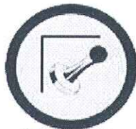
Početak zone Žuta