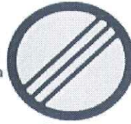
Kraj zone Oranž