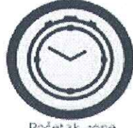
Početak zone Žuta