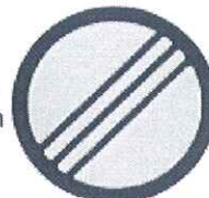
Kraj zone Oranž