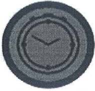
Sudijski sto VK Crvena