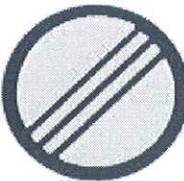
Kraj zone Oranž