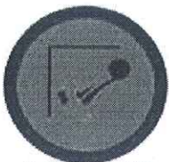
Sudijski sto PK Crvena